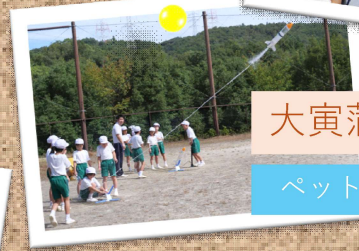
大寅蒲鉾工場見学